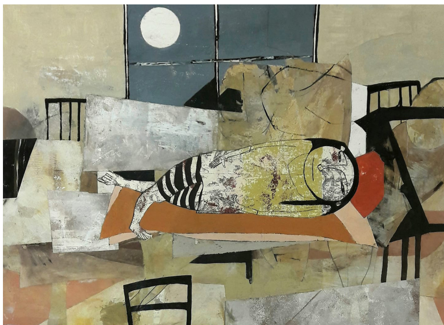
Elke Pollack »Mädchen auf Sofa« Öl, Strukturpaste, Collage, Monotypie, Stifte, 52 x 73 cm (2019)