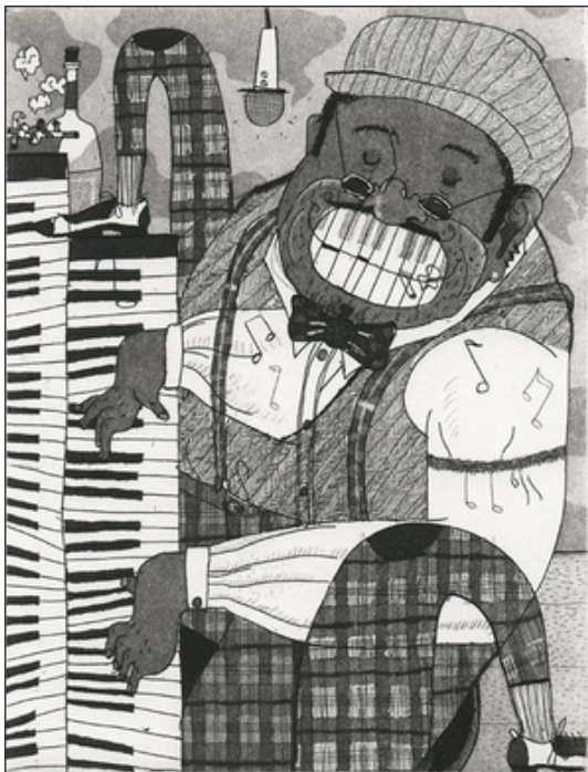
Sarah Deibele »Jazzpianist« Radierung und Aquatinta, 13 x 10 cm (2018)