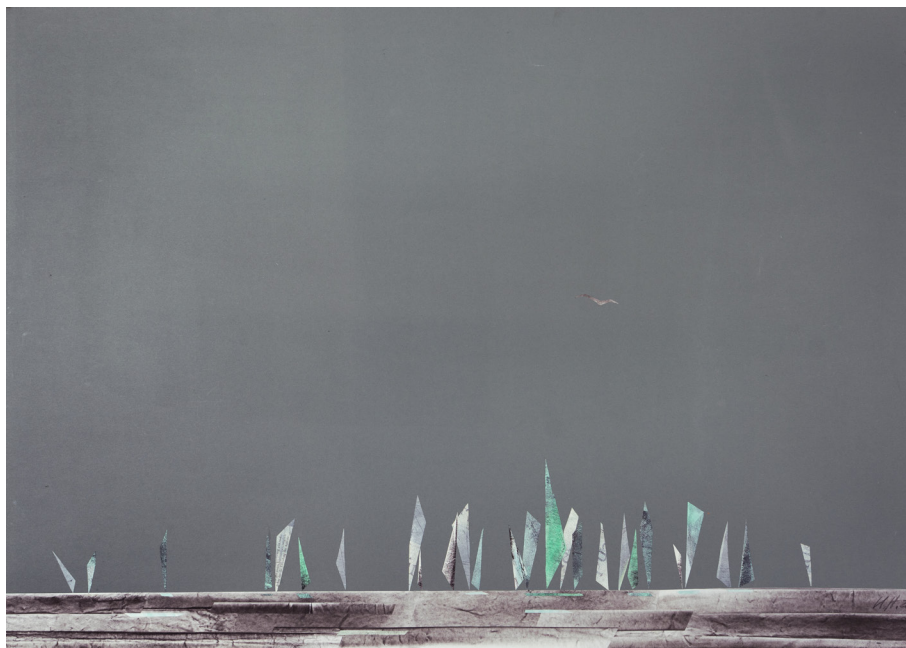
Ursula Strozynski »Regatta XX« Collage auf grauem Karton, 69 x 97 cm (2020)