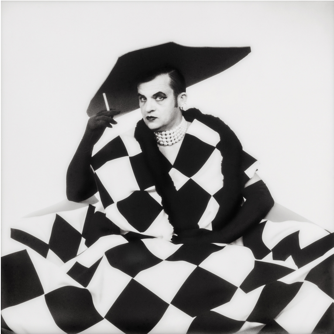
Wetzel & Schuster (Daniel Wetzel und Gregor Schuster) »Supermodel #20« Fotografie, 30 x 30 cm (2012–2016)