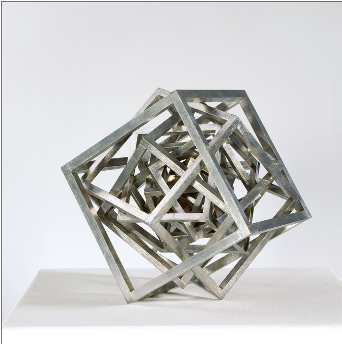
Hartmut Sy »Chinesischer Würfel« Messing und Zinn, 17 x 19,5 x 19 cm (2020)