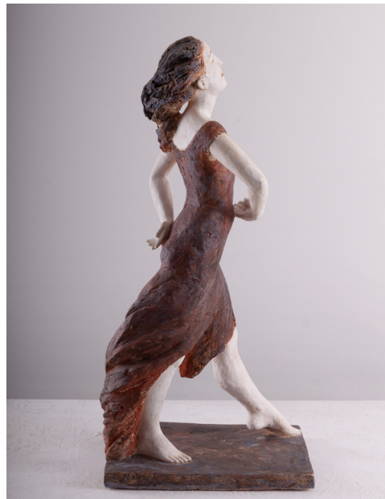
Heike Adner »Tänzerin« Terrakotta, farbig gefasst, H = 64 cm (2019)