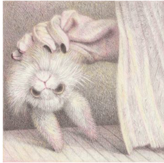
Gudrun Schäfer »Trick« Farbstift, 11,5 x 11,5 cm (2019)