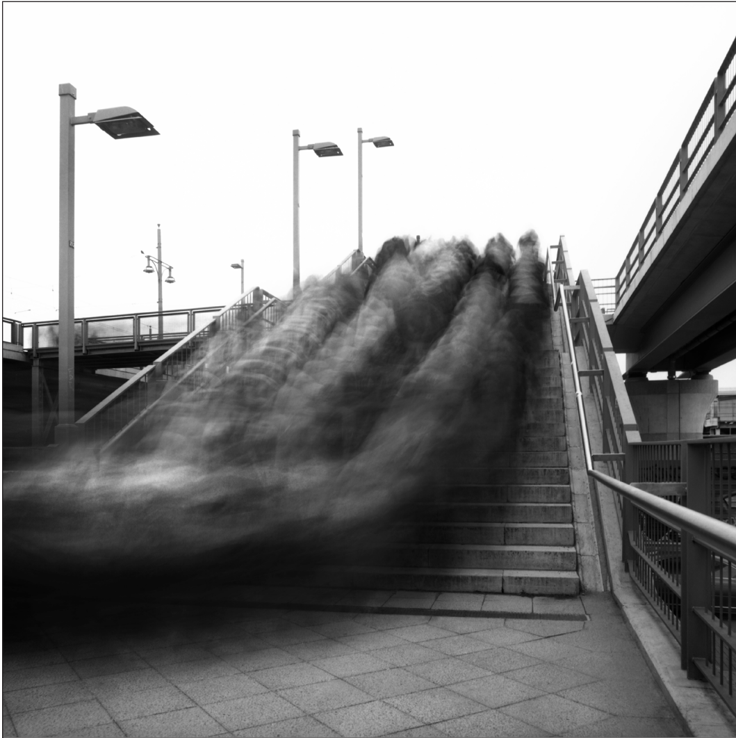
Frank Machalowski »monster#2« Fotografie, 70 x 70 cm (2012)