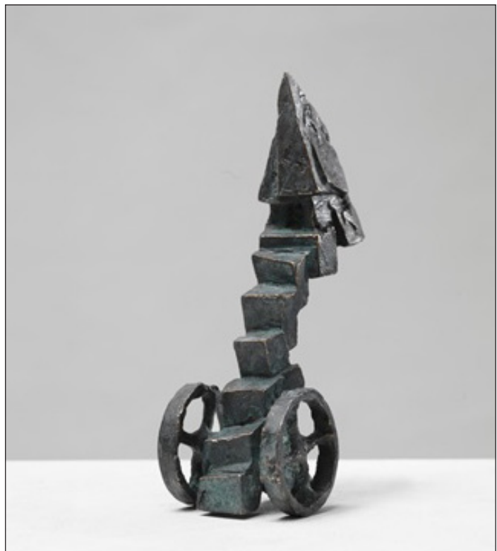
Michael Jastram »Treppenhaus« Bronze, H = 18 cm (2009)