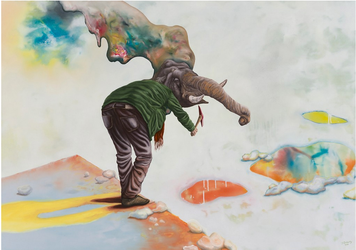
Jill Tegan Doherty »It Sucks« Öl auf Leinwand, 90 x 130 cm (2018)