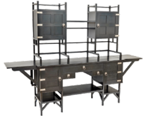
Foto: Edward William Godwin/William Watt, London, Buffet, 1876. Privatsammlung. © Martin Adam

Calderon -Holzrestaurierung und Holzbildhauerei , Valentin José Kammel, c/o Becker, Schwarzkopffstraße 8, Erdgeschoss, 10115 Berlin, Tel.: 0176-56913744, www.calderon-restaurierung.com; Freitag, Samstag, Sonntag: 10 bis 17 Uhr, Vorführung. Schauen Sie mir beim Schnitzen und Restaurieren von Holzobjekten über die Schulter.